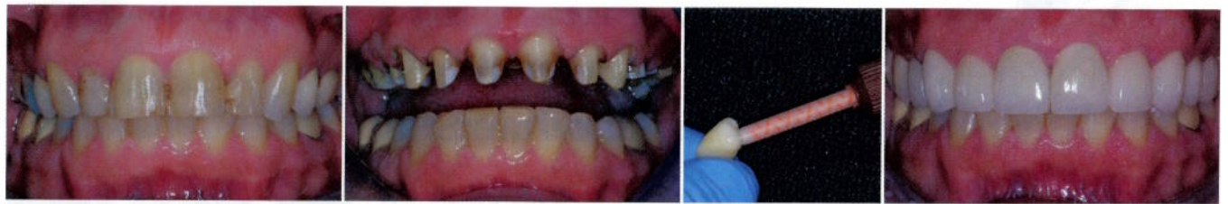
Abb. 1: Gesamtansicht eines Patienten vor der Behandlung. – Abb. 2: Präparationen. – Abb. 3: Einbringen von Maxcem™ Elite in Lava-Krone. – Abb. 4: Postoperative Gesamtansicht der zementierten Restaurationen.